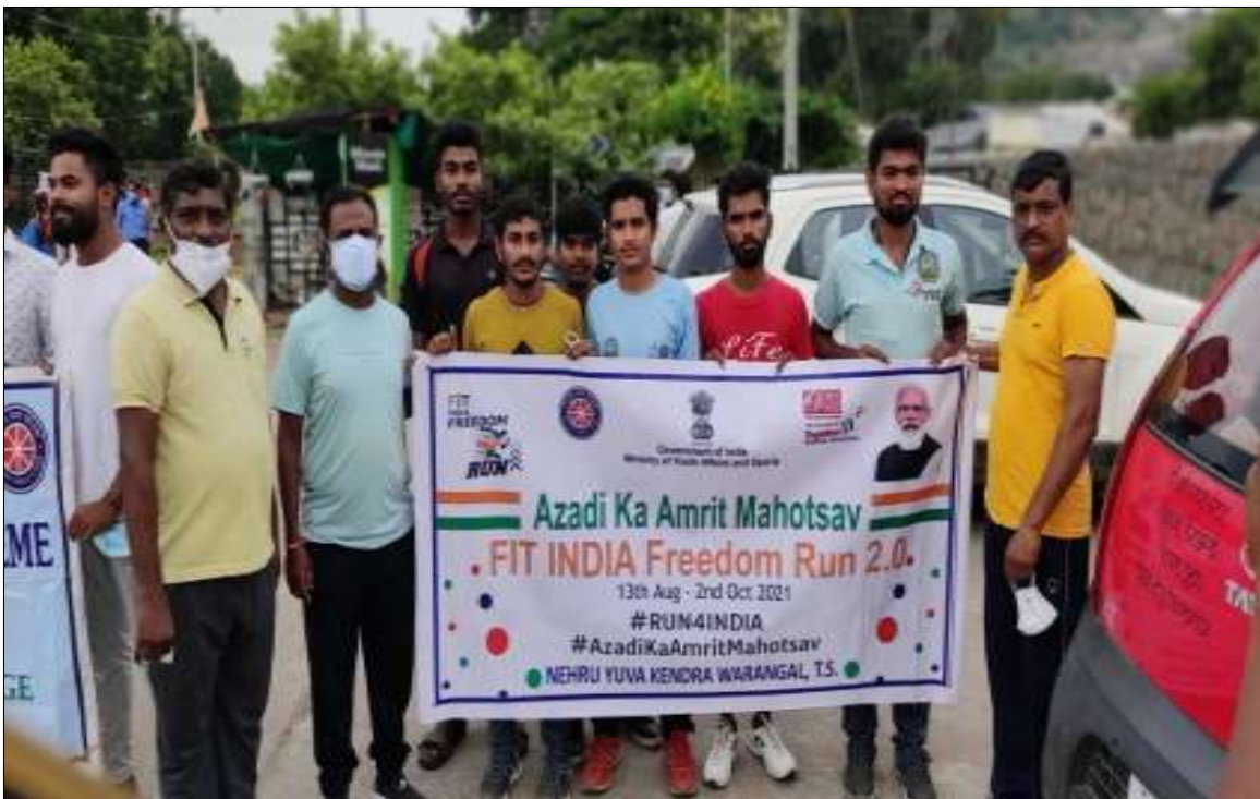
NSS Volunteers participated in 4k Run for Fit India on 13-08-2021