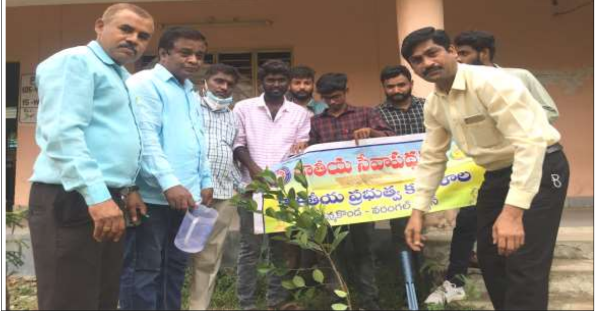
All the faculty members along with NSS units participated in Harithaharam on 31-07-2021

{In collaboration with Government of Telangana}