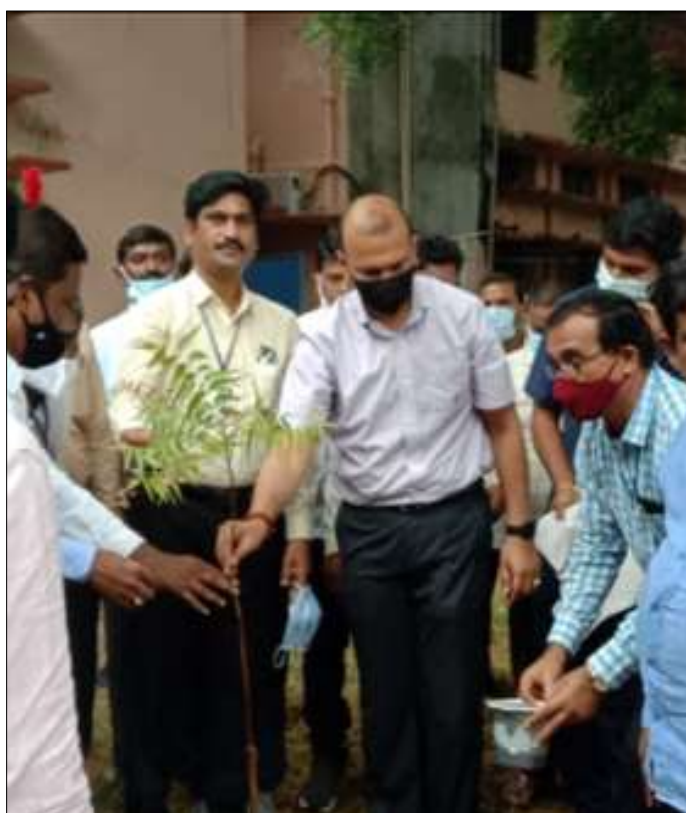
Sri. Naveen Mittal IAS, Commissioner of Collegiate Education planting a plant in college- Initiation taken by NSS Units